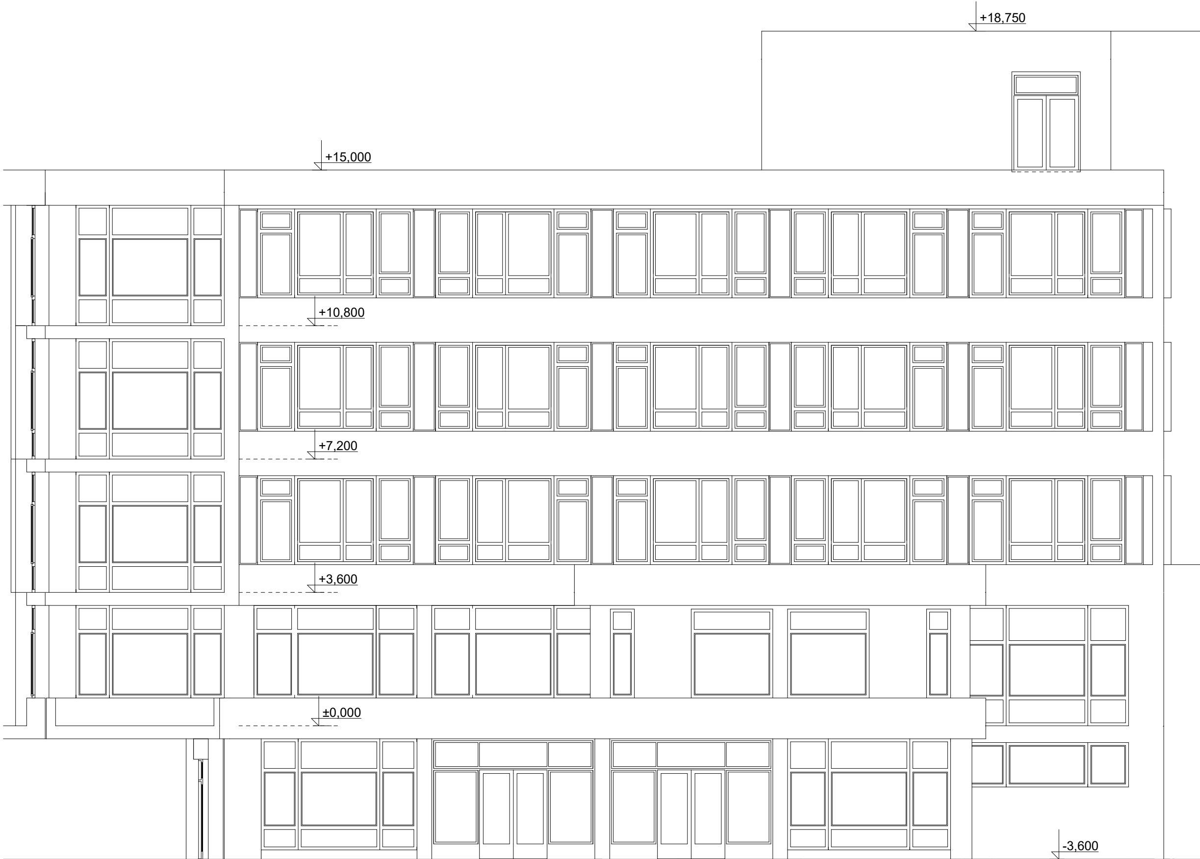
POHLED VÝCHODNÍ STÁVAJÍCÍ STAV