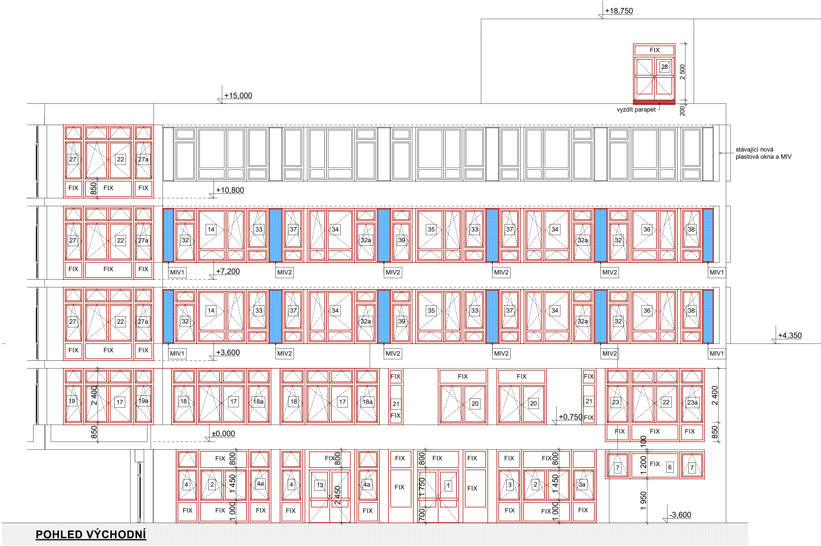
POHLED VÝCHODNÍ NOVÝ STAV